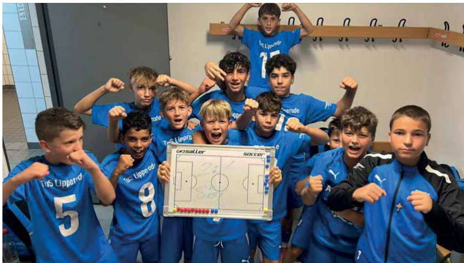
Das Kabinenselfie darf heutzutage auch im Jugendbereich nicht fehlen.