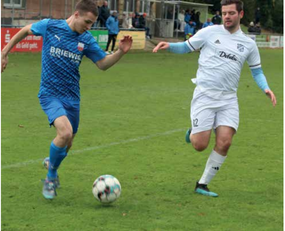
In Mönninghausen kassierte der TuS eine verdiente 1:3-Niederlage.